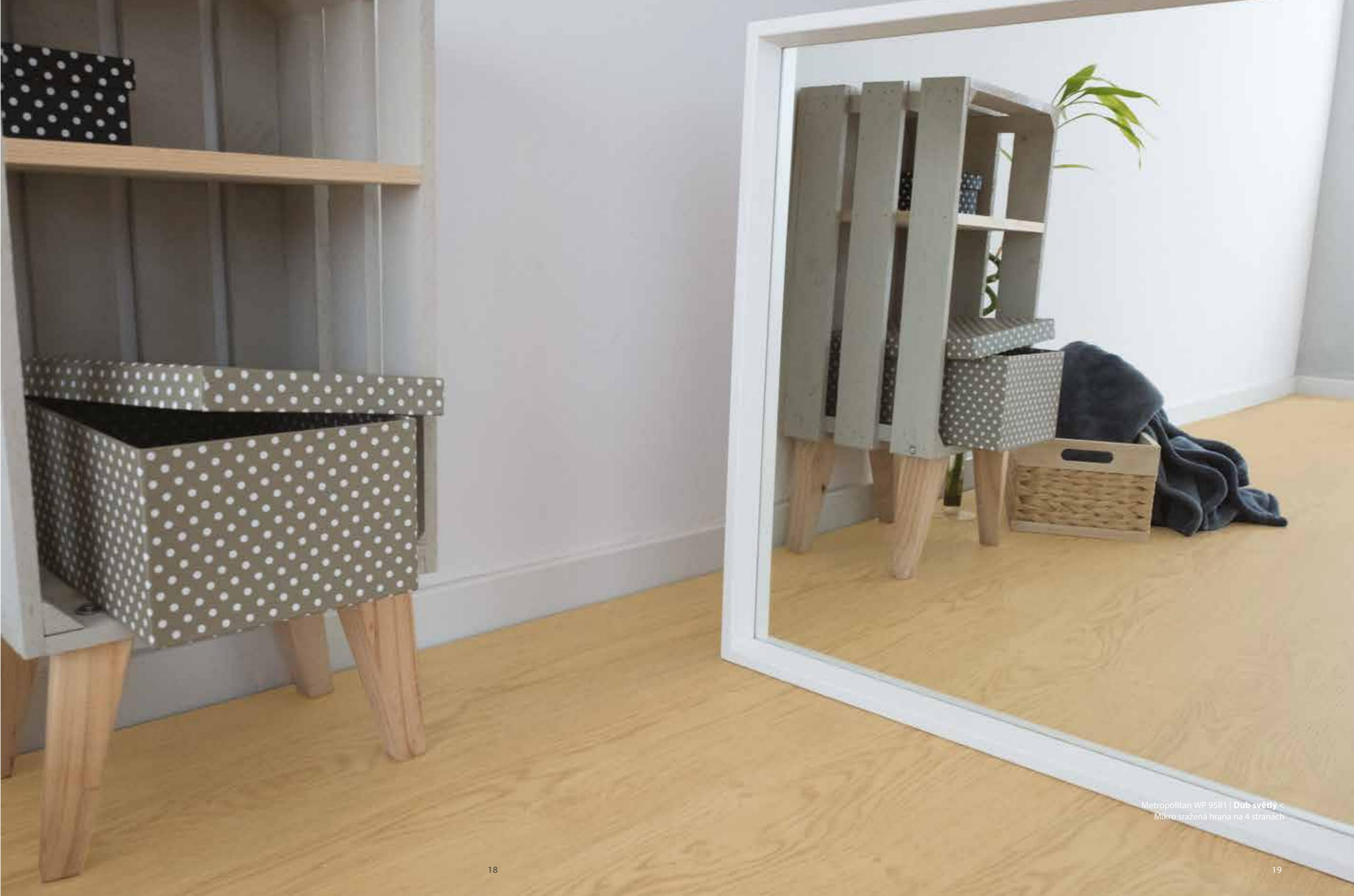
Metropolitan WP 9581 | Dub světlý < Mikro sražená hrana na 4 stranách