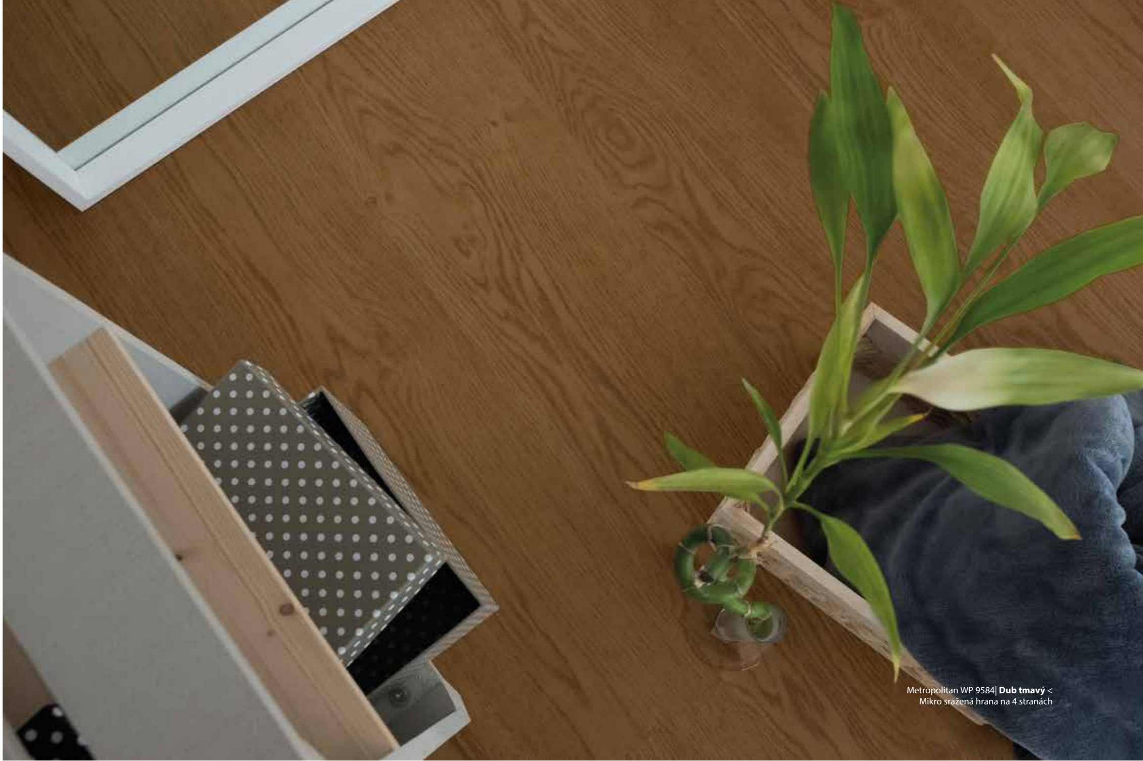
Metropolitan WP 9584| Dub tmavý < Mikro sražená hrana na 4 stranách