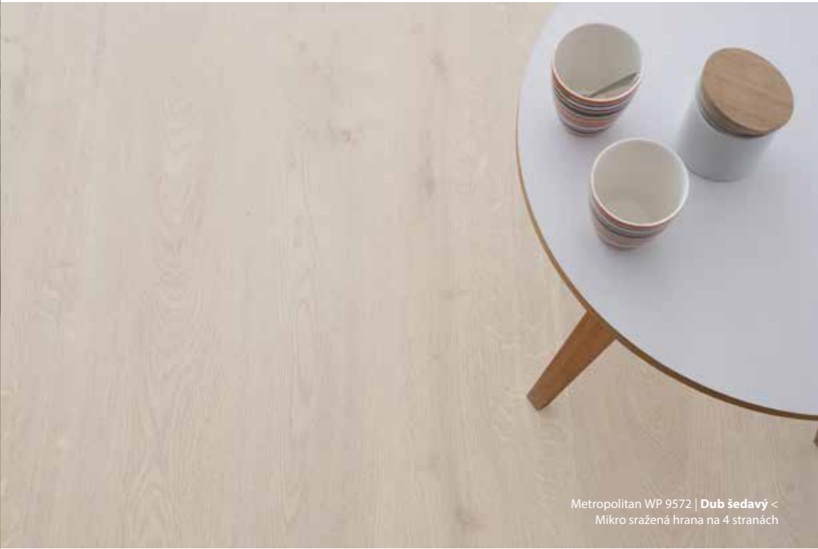
Metropolitan WP 9572 | Dub šedavý < Mikro sražená hrana na 4 stranách