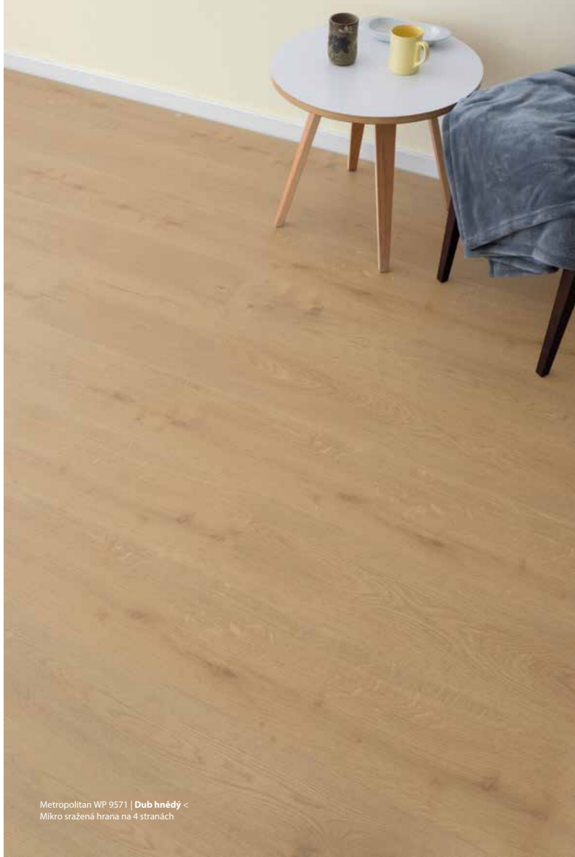
Metropolitan WP 9571 | Dub hnědý < Mikro sražená hrana na 4 stranách