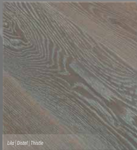
Lila | Distel | Thistle