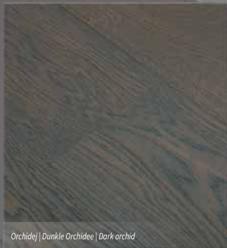
Orchidej | Dunkle Orchidee | Dark orchid