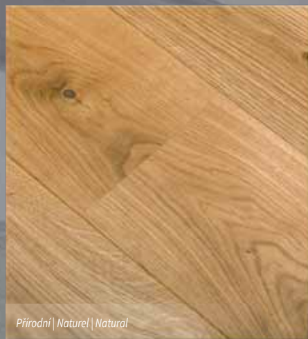
Přírodní | Naturel | Natural