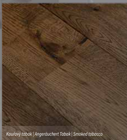
Kouřový tabák | Angeräuchert Tabak | Smoked tobacco