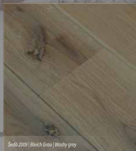
Šedá 2009 | Bleich Grau | Washy grey