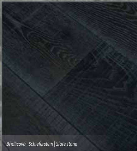
Břidlicová | Schieferstein | Slate stone