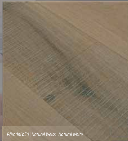
Přírodní bílá | Naturel Weiss | Natural white