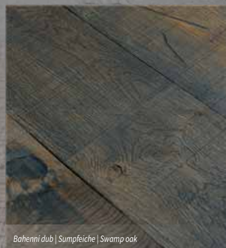
Bahenní dub | Sumpfeiche | Swamp oak