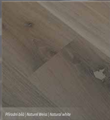
Přírodní bílá | Naturel Weiss | Natural white