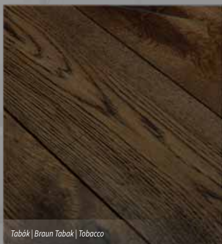
Tabák | Braun Tabak | Tobacco