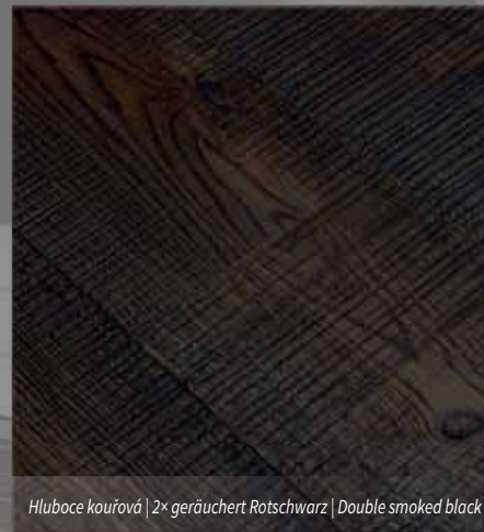
Hluboce kouřová | 2x geräuchert Rotschwarz | Double smoked black