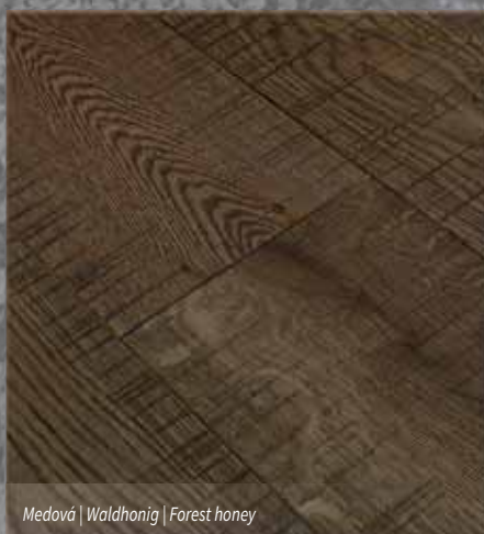
Medová | Waldhonig | Forest honey