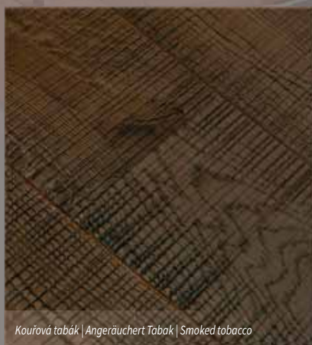
Kouřová tabák | Angeräuchert Tabak | Smoked tobacco