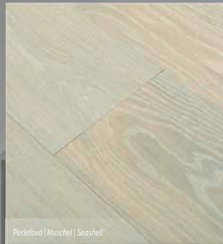
Perleťová | Muschel | Seashell