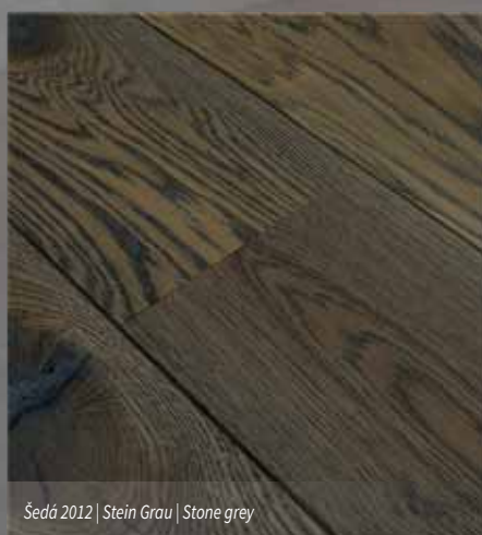
Šedá 2012 | Stein Grau | Stone grey