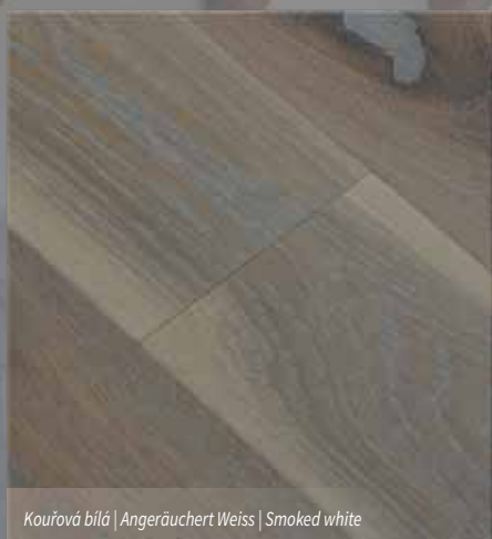
Kouřová bílá | Angeräuchert Weiss | Smoked white