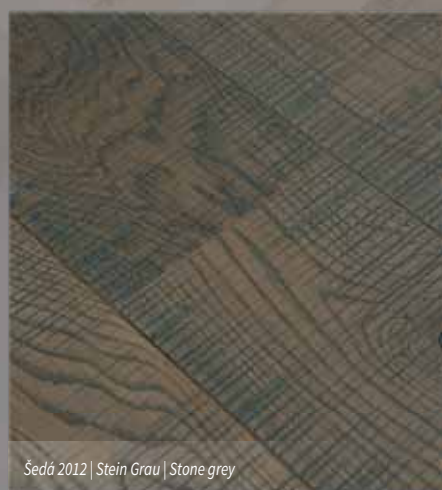
Šedá 2012 | Stein Grau | Stone grey