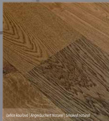
Lehce kouřová | Angeräuchert Naturel | Smoked natural