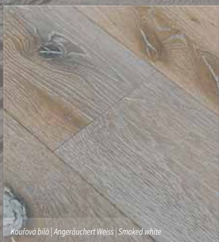
Kouřová bílá | Angeräuchert Weiss | Smoked white