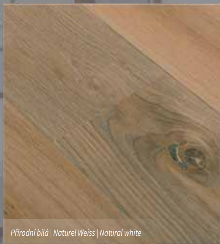
Přírodní bílá | Naturel Weiss | Natural white