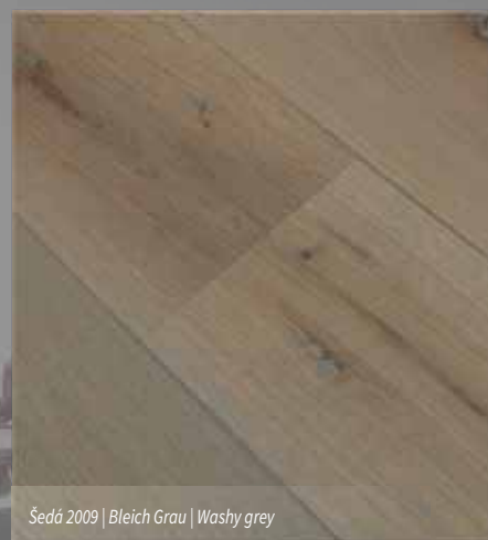
Šedá 2009 | Bleich Grau | Washy grey