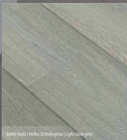
Světle šedá | Helles Schiefergrau | Light slate grey