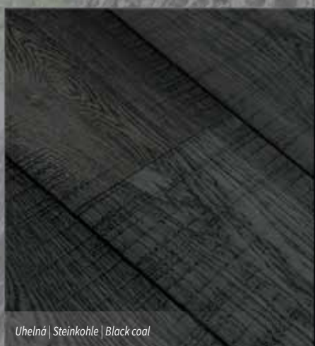
Uhelná | Steinkohle | Black coal