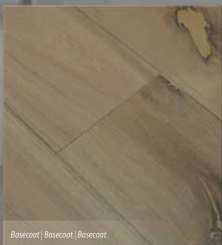
Basecoat | Basecoat | Basecoat