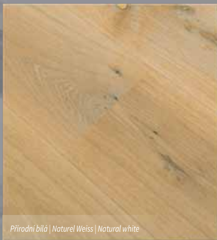
Přírodní bílá | Naturel Weiss | Natural white