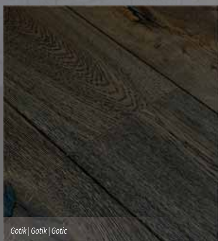
Gotik | Gotik | Gotik