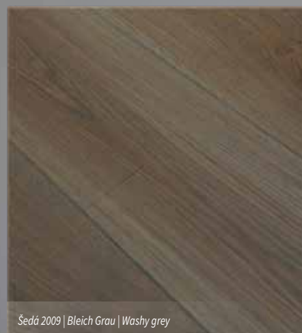
Šedá 2009 | Bleich Grau | Washy grey