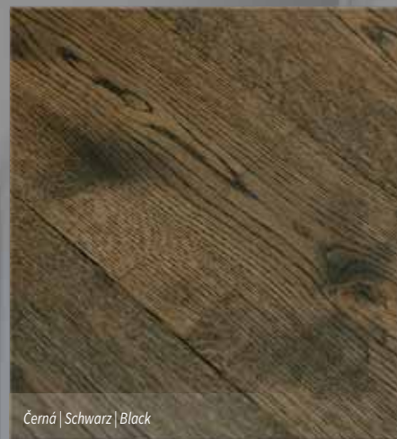
Černá | Schwarz | Black