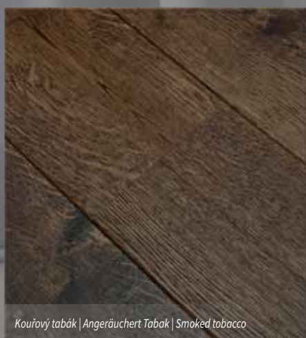
Kouřový tabák | Angeräuchert Tabak | Smoked tobacco