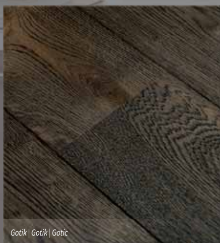
Gotik | Gotik | Gothic