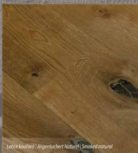
Lehce kouřová | Angeräuchert Naturel | Smoked natural