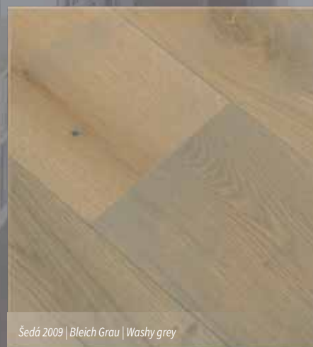
Šedá 2009 | Bleich Grau | Washy grey