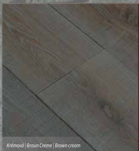
Krémová | Braun Creme | Brown cream