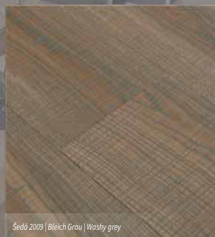
Šedá 2009 | Bleich Grau | Washy grey