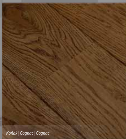
Kaňák | Cognac | Cognac