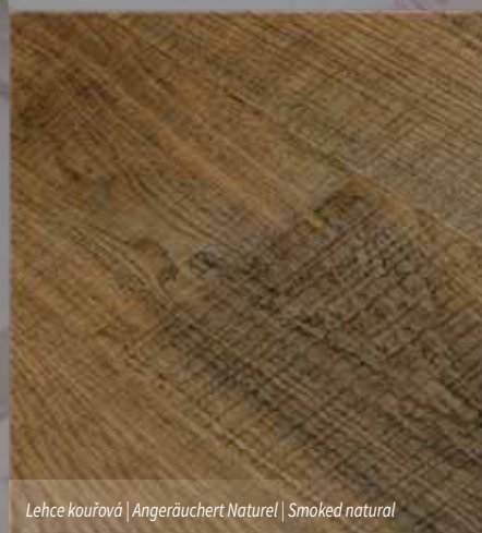
Lehce kouřová | Angeräuchert Naturel | Smoked natural