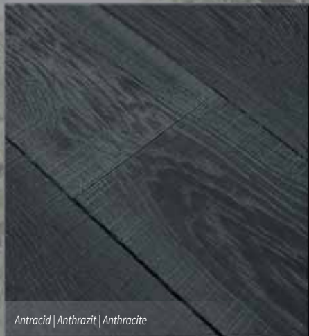
Antracid | Anthrazit | Anthracite