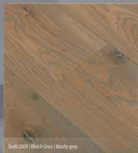
Šedá 2009 | Bleich Grau | Washy grey