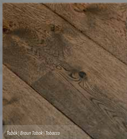
Tabák | Braun Tabak | Tobacco