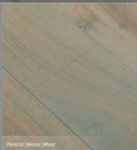
Pšeničná | Weizen | Wheat