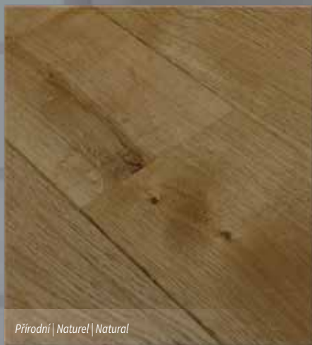
Přírodní | Naturel | Natural