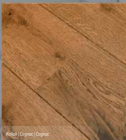
Čoňák | Cognac | Cognac