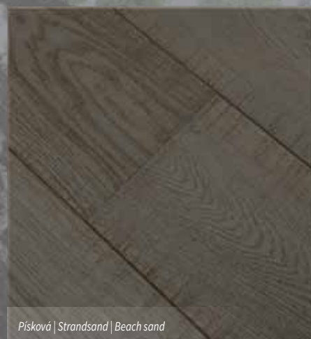
Písková | Strandsand | Beach sand