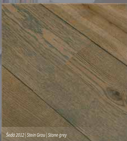
Šedá 2012 | Stein Grau | Stone grey