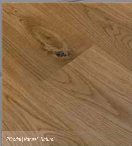
Přírodní | Naturel | Natural