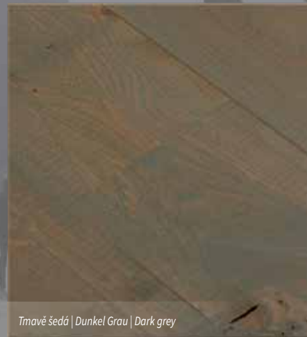
Tmavě šedá | Dunkel Grau | Dark grey