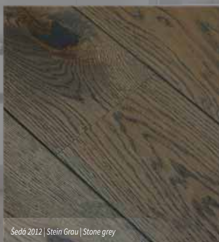
Šedá 2012 | Stein Grau | Stone grey