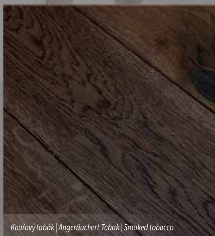
Kouřový tabák | Angeräuchert Tabak | Smoked tobacco