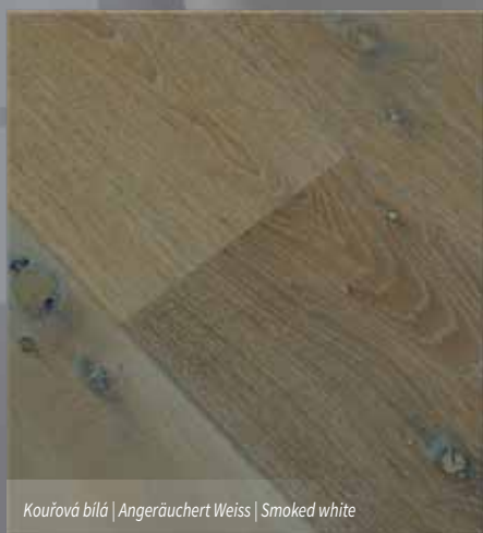
Kouřová bílá | Angeräuchert Weiss | Smoked white