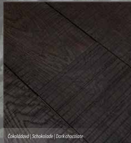
Čokoládová | Schokolade | Dark chocolate