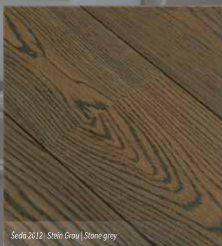
Šedá 2012 | Stein Grau | Stone grey