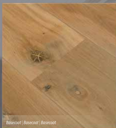
Basecoat | Basecoat | Basecoat