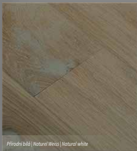
Přírodní bílá | Naturel Weiss | Natural white