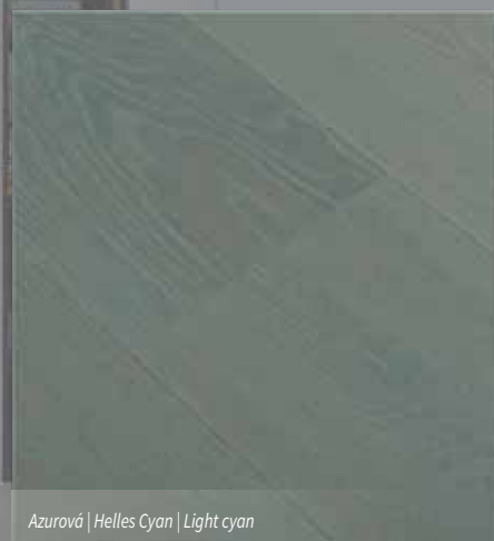
Azurová | Helles Cyan | Light cyan