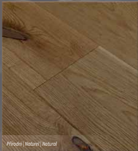
Přírodní | Naturel | Natural