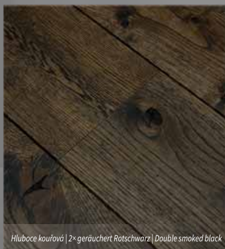
Hluboce kouřová | 2x geräuchert Rotschwarz | Double smoked black