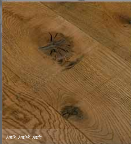
Antik | Antiek | Antic