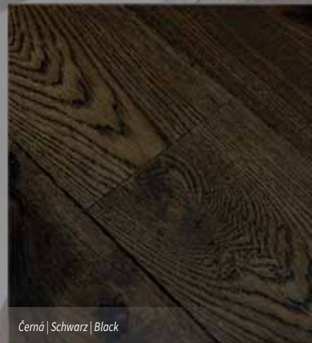
Černá | Schwarz | Black