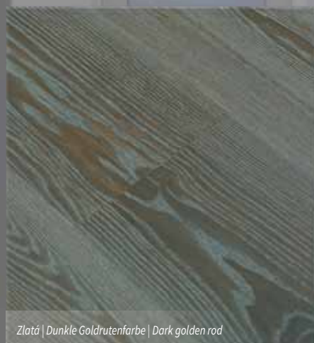
Zlatá | Dunkle Goldrutenfarbe | Dark golden rod