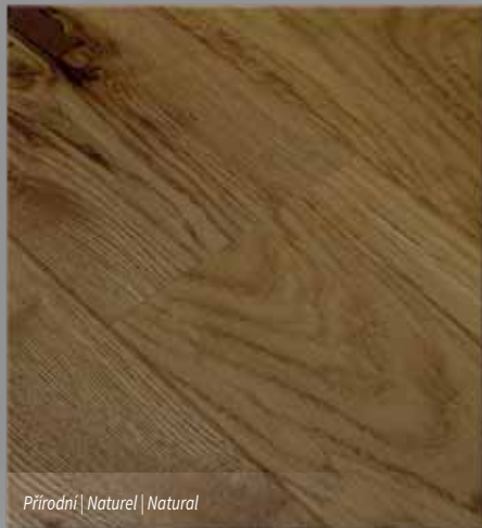
Přírodní | Naturel | Natural