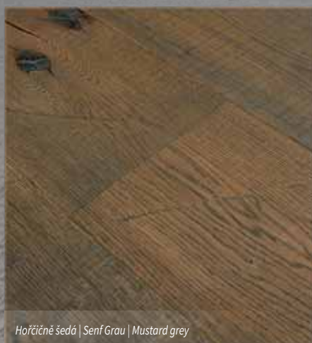
Hořčičně šedá | Senf Grau | Mustard grey