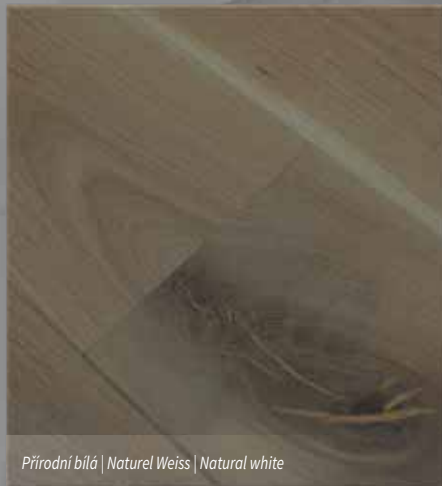
Přírodní bílá | Naturel Weiss | Natural white