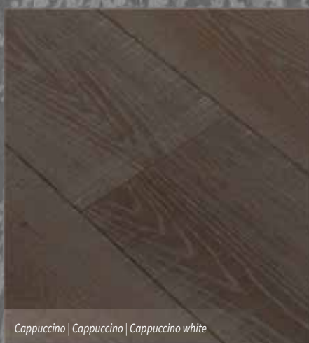
Cappuccino | Cappuccino | Cappuccino white