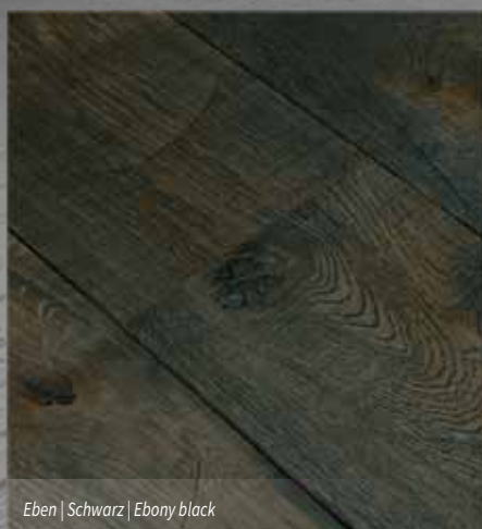
Eben | Schwarz | Ebony black