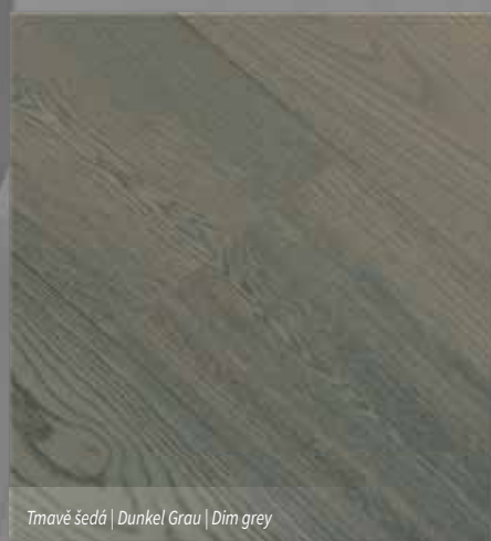
Tmavě šedá | Dunkel Grau | Dim grey