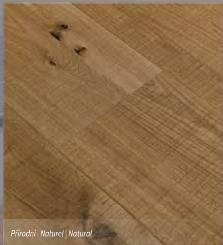
Přírodní | Naturel | Natural