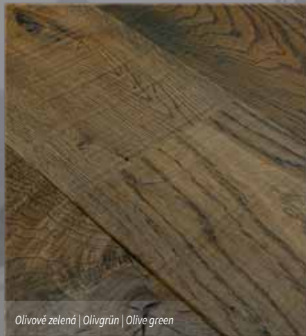
Olivově zelená | Olivgrün | Olive green