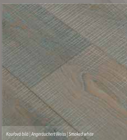
Kouřová bílá | Angeräuchert Weiss | Smoked white