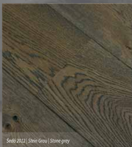
Šedá 2012 | Stein Grau | Stone grey