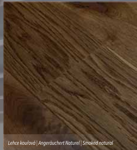
Lehce kouřová | Angeräuchert Naturel | Smoked natural