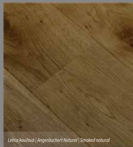
Lehce kouřová | Angeräuchert Naturel | Smoked natural