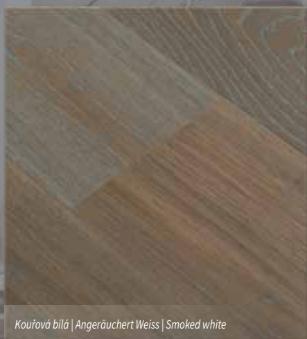
Kouřová bílá | Angeräuchert Weiss | Smoked white